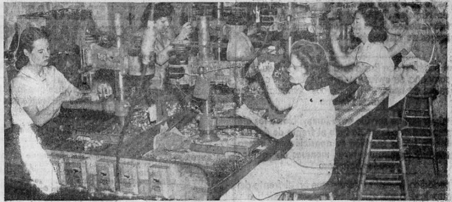
En esta fotografía se presenta a un grupo de mujeres que trabaja en una de las grandes fábricas norteamericanas dedicadas a la defensa nacional. Las mujeres han probado ser magníficas operarias en taladradoras de presión donde la precisión en el trabajo es un factor vitalísimo.

Hasta ahora, las obreras son utilizadas en trabajos fáciles que no requieren esfuerzos inten-