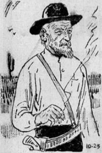
Era un viejo con barbas

—¡Le estamos ofreciendo dinero contante y sonoro por esa anticuada que no le sirve para nada. ¡Dinero efectivo. ¡Comprende.